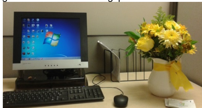
Mein Schreib-Tisch im Office der Film Commission

des Umzugs, da sich die Film Commission just in der Zeit meines Praktikums in einer großen Umstrukturierungsphase befand.