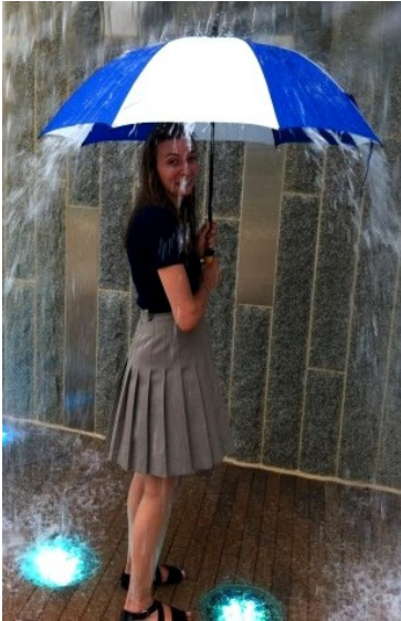
Little Shower in the Park in Charlottes beliebtem Romare Bearden Park