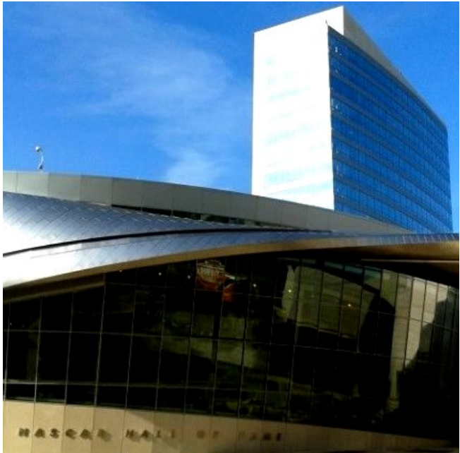
An der Nasca Plaza von Charlotte – mein Arbeitsplatz in der Film Commission

heit. Während meiner Grace Period hatte ich zudem das Vergnügen, mich auf eine Reise durch die Südstaaten zu begeben und mich von der Geschichte historischer Städte wie Charleston und Savannah , von den wilden Küstenregionen Georgias und den kühlen Smokey Mountains bezaubern zu lassen.